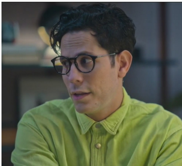
Christian Chávez en LA SUERTE DE LOLI